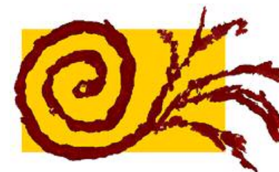
Intercultureel Netwerk Gent v.z.w.